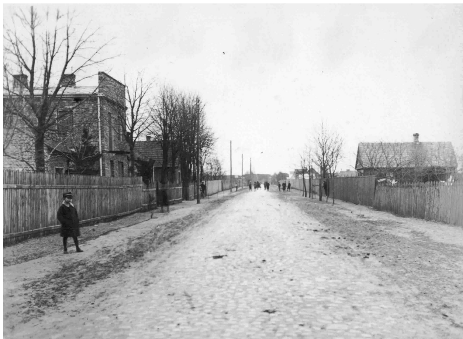
43. Dawna ulica Królewska, następnie Józefa Piłsudskiego, obecnie gen. Franciszka Żymirskiego. Rok 1934. Por. Kobylka. Migawki pamięci . Kobylka 2006, s. 47.