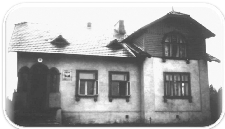
33. Siedziba Urzędu Gminy Kobyłka w latach trzydziestych XX w.