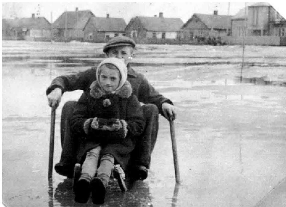
45. Naturalne lodowisko na Rynku (Placu 15 Sierpnia).