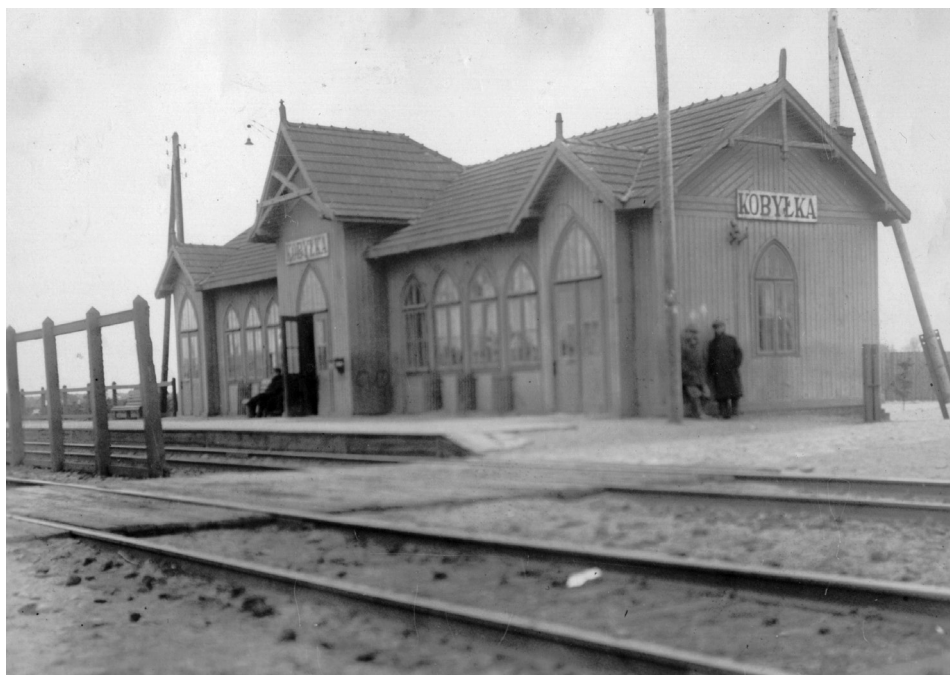
27. Budynek stacji kolejowej w Kobyłce oddany do użytku w 1924 r. Źródło: zbiory Mirosława Bujalskiego. Por. Kobyłka. Migawki pamięci . Kobyłka, 2006, s. 40.