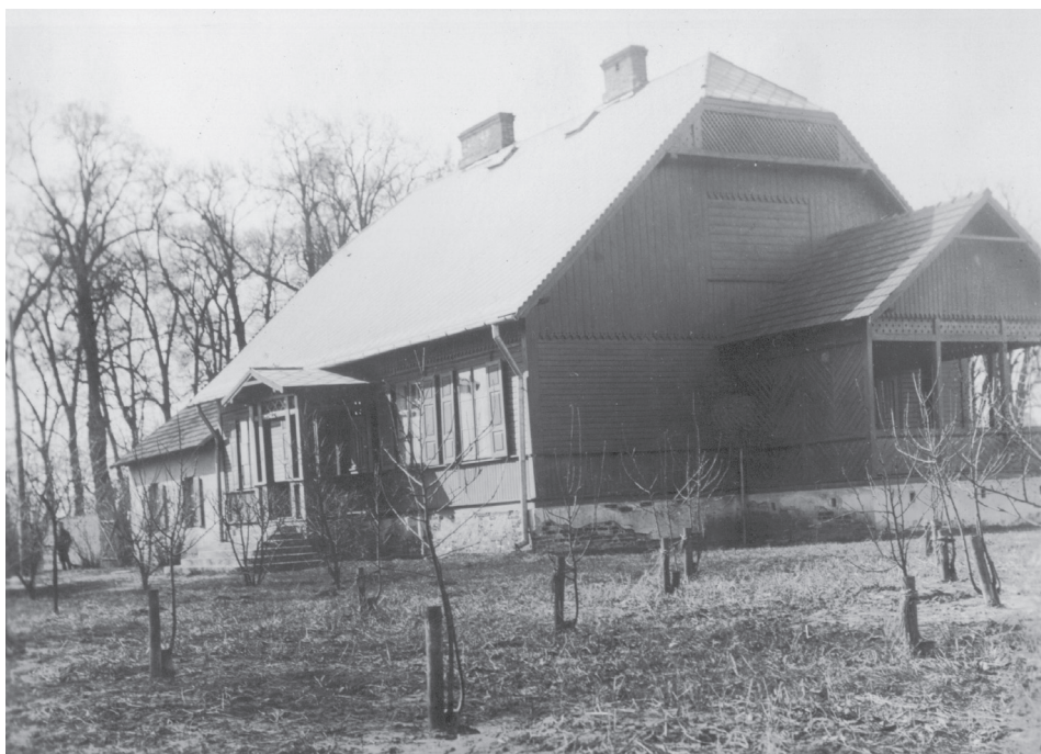
31. Dwór Antoniego Országha w latach trzydziestych XX w. Por. Kobyłka. Migawki pamięci . Kobyłka 2006, s. 45.